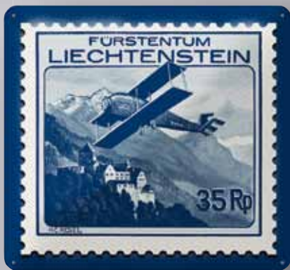
DOPPELDECKER ÜBER SCHLOSS VADUZ 40 X 40 CM CHF 27.00