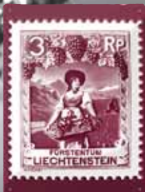
WINZERIN 20 X 30 CM CHF 24.00