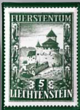
SCHLOSS VADUZ 30 X 40 CM CHF 24.00